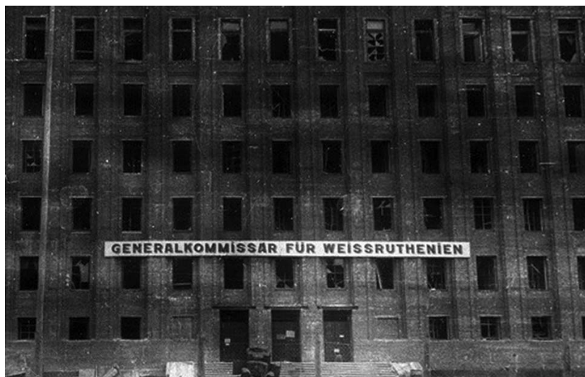
Карла Маркса вул., 38. Ліпень 1944 г.