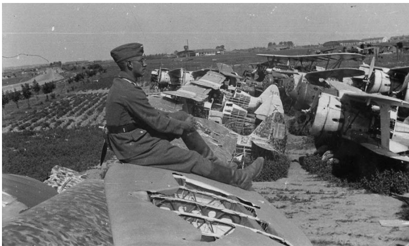
Былы Лошыцкі аэрадром (Minsk-Süd)