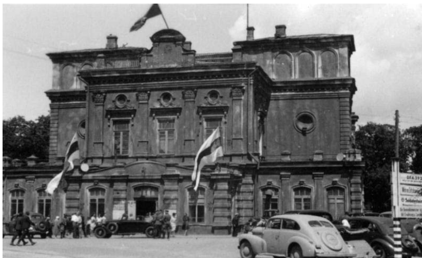
Энгельса вул., 7. Чэрвень 1943 г.