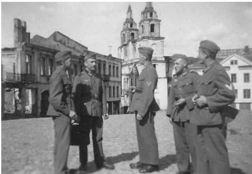
Кірыла і Мяфодзія вул., 3 (у цэнтры)