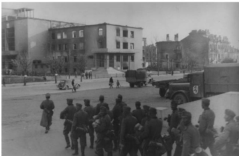
Савецкая вул., 18. 1941 г.